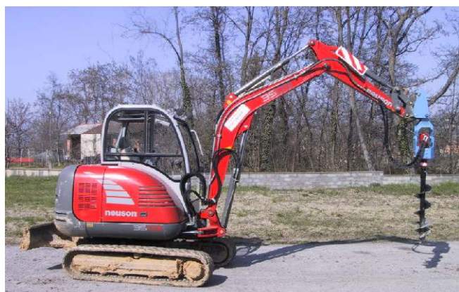
TYPE PG 201

TRIVELLA IDRAULICA PG 201 DRILL - AUGERS DRIVE UNITS BOHRGERÄT HYDRAULISCH AHOYADORES HIDRÁULICO